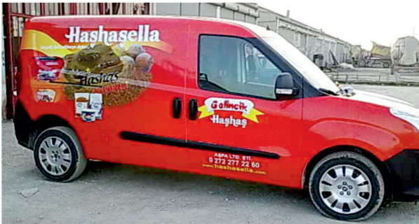
Haşhaşella / Araç Giydirme