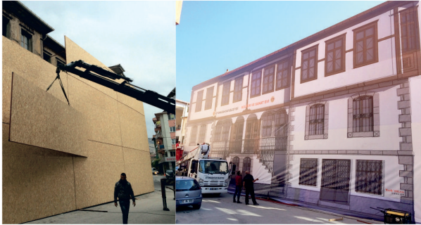
Kültür ve Sanat Evi / Cephe Kaplama