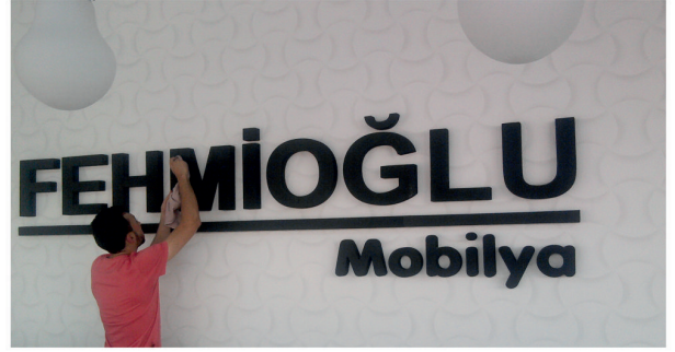
Fehmiođlu Mobilya / Kutu Harf