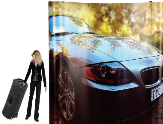
Fuar Tanıtım Standları