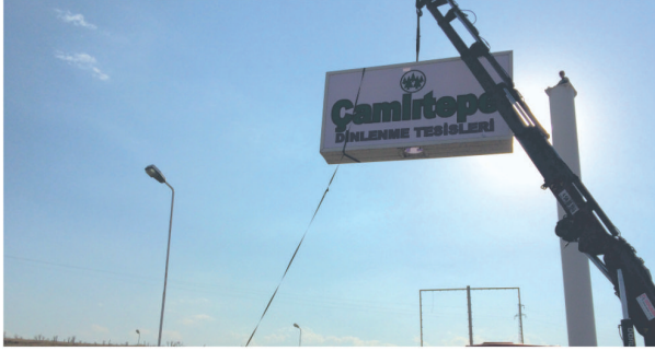
Çamlıtepe Dinlenme Tes. / Totem Tabela