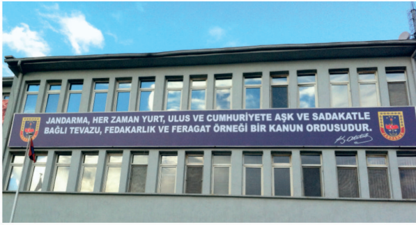
Jandarma Komutanlığı / Germe Tabela