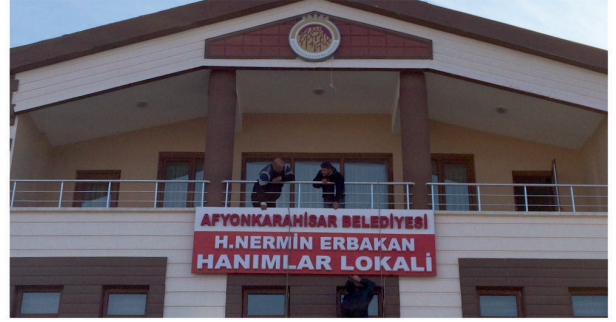
Hanımlar Lokali / Plexi Kutu Harf Tabela