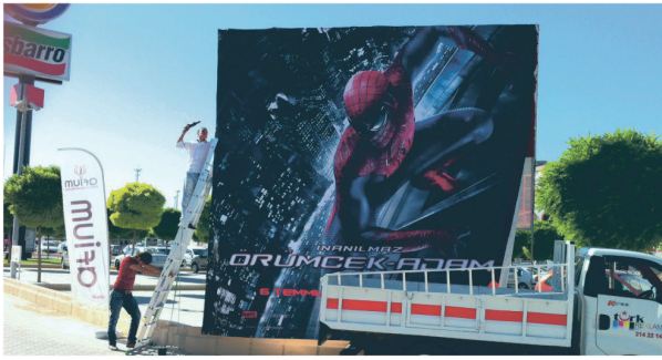
Afium Sinema / Tanıtım Panosu