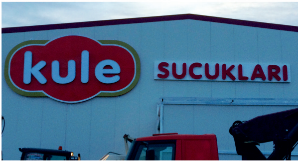
Kule Sucukları / Işıklı Alüminyum Kutu Harf