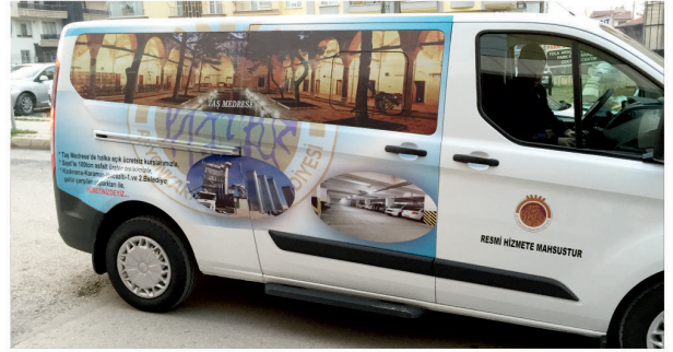
Afyonkarahisar Belediyesi / Araç Giydirme