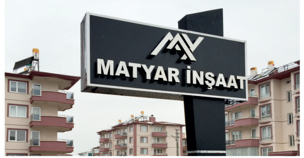
Matyar İnşaat / Krom Kutu Harf - Totem Tabela