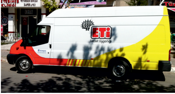
Dempař / Araç Giydirme