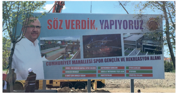
Spor Kompleksi / Totem Tabela