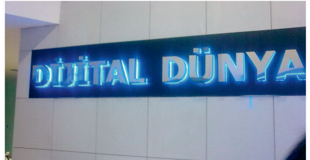
Dijital Dünya / Krom Kutu Harf