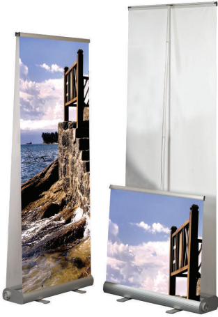
Smart Roll Banner