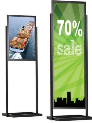
Ayaklı Işıklı Poster Pano