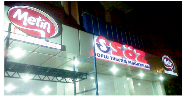
Söz Toplu Tüketim Mağazaları / Işıklı Harf Tabela