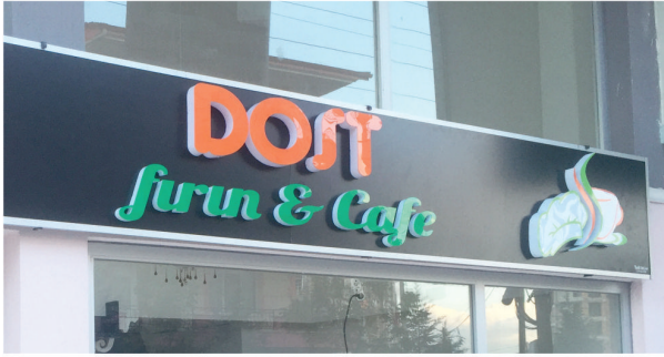
Dost Fırın & Cafe / Işıklı Plexi Kutu Harf Tabela