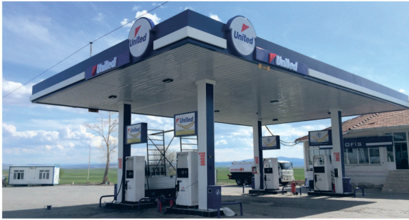
United Akaryakıt Tesisi / Cephe Kaplama