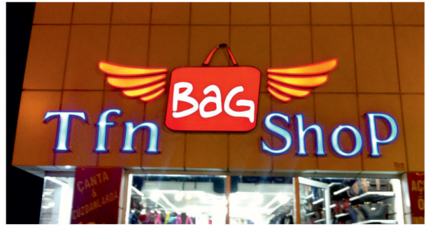
Tfn Bag Shop / Işıklı Fileli Kutu Krom Harf