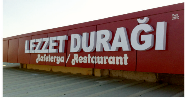
Lezzet Durağı / Işıklı Plexi Kutu Harf