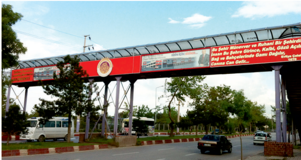
Üst Geçit / Reklam ve Cephe Kaplama