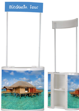
Oval Tanıtım Standı