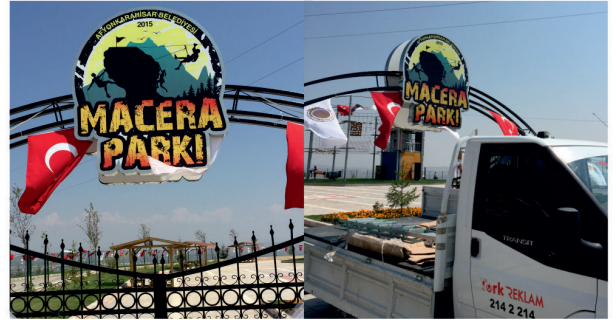
Macera Parkı / Işıklı Fileli Krom Logo