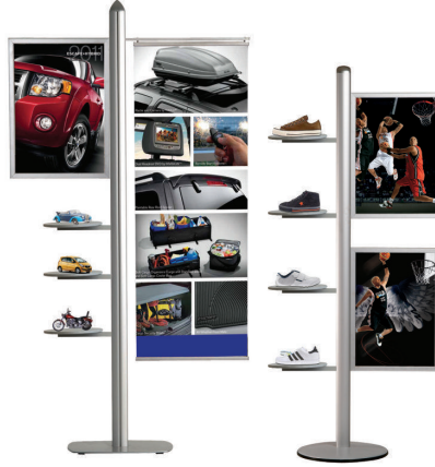
Ayarlanabilir Menü Panosu