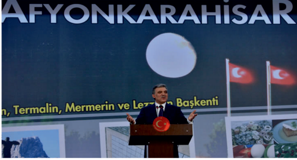
Korel Termal Otel / Konuşma Platformu