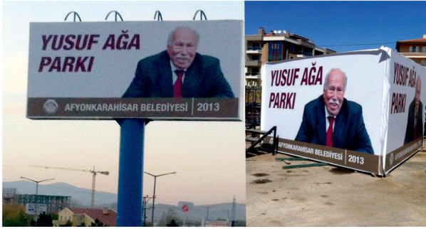
Yusuf Ağa Parkı / Totem Tabeları