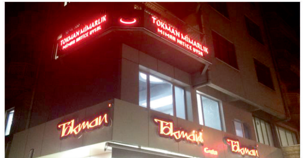
Tokman Yumurta / Kutu Harf Işıklı Tabela