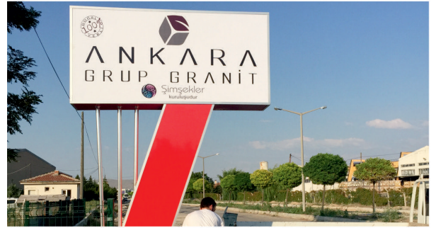
Ankara Grup Granit / Totem Tabela